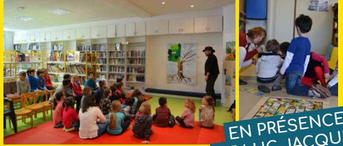
EN PRÉSENCE DE LUC JACQUET